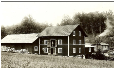
Malms Kvarn foto från 1914

I senaste numret av Stora Milstolpen föll en artikel bort av misstag. Det var berättelsen om Malms Kvarn , av Sven Jönsson . Det var en oförklarlig miss som vi härmed djupt beklagar. Artikeln kommer med i nästa "stora" Milstolpen nr 4-2014. Red.