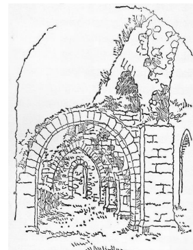
Alvastra kyrkoruin (ur boken Tusen sevärigheter i Sverige)

PS Resultatet av RAÄs markundersökning 2013 finns publicerad på webben ( Google Tunaborgen ). Vi kommer att utförligare redovisa den i nästa nr av stora Milstolpen.tillsammans med senaste nyheterna om borgen.